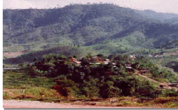
บริเวณที่พบ

ลักษณะโดยทั่วไป: ดินนี้ประกอบด้วยพื้นที่ภูเขา ซึ่งมีความลาดชันมากกว่า 35% ดินที่พบในบริเวณดังกล่าวนี้มีทั้งดินลึกและดินตื้น ลักษณะของเนื้อดินและความอุดมสมบูรณ์ตามธรรมชาติแตกต่างกันไปแล้วแต่ชนิดของหินต้นกำเนิดในบริเวณนั้น มักมีเศษหิน ก้อนหิน หรือหินพื้น โส่ กระจายอยู่ทั่วไป ส่วนใหญ่ยังปกคลุมด้วยป่าไม้ประเภทต่าง ๆ เช่น ป่าเบญจพรรณ ป่าเต็งรัง หรือป่าดิบชื้น หลายแห่งมีการทำไร่เลื่อนลอย โดยปราศจากมาตรการในการอนุรักษ์ดินและน้ำ ซึ่งเป็นผลทำให้เกิดการชะล้างพังทลายของดิน จนบางแห่งเหลือแต่หินพื้น โส่ ได้แก่ชุดดินที่ลาดชันเชิงซ้อน (Sc) กลุ่มชุดดินนี้ไม่ควรนำมาใช้ประโยชน์ทางการเกษตร เนื่องจากมีปัญหาหลายประการที่มีผลกระทบต่อระบบนิเวศน์ควรสงวนไว้เป็นป่าตามธรรมชาติ เพื่อรักษาแหล่งต้นน้ำลำธาร